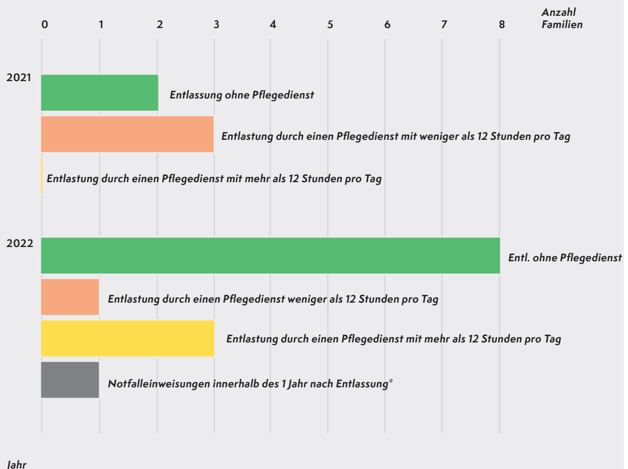
Darstellung der Entlassungen von Familien aus der Betreuung im Haus Atemzeit sowie des Unterstützungsbedarfs nach dem Aufenthalt

Neben der Förderung der Kinder ist es uns ein großes Anliegen, den Familien trotz ihrer komplex erkrankten Kinder einen sicheren Übergang in ihr eigentliches Zuhause zu ermöglichen. So sind 8 Familien nach ihrer Zeit bei uns allein – ohne Pflegedienst – in ihr eigentliches Zuhause gezogen und weitere 4 Kinder sind mit deutlich reduzierten Pflegedienstleistungen nach Hause entlassen worden. Im Rahmen einer palliativen Begleitung haben wir, in Zusammenarbeit mit einem Palliativteam, 2 Kinder und deren Familien auf ihrem letzten Weg begleitet.